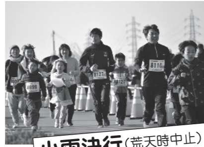
小雨決行(荒天時中止)